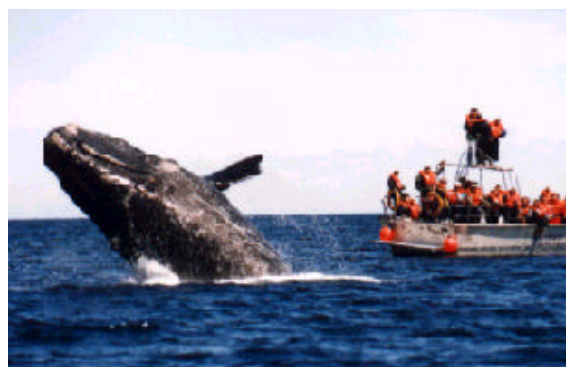
Atractivos turísticos de la provincia